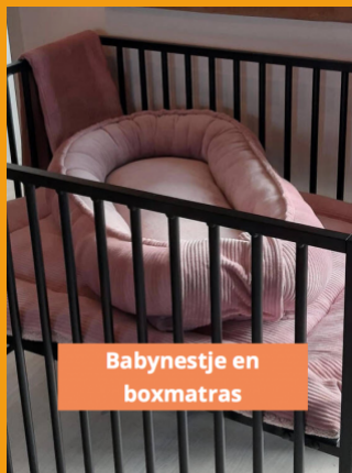
Babynestje en boxmatras