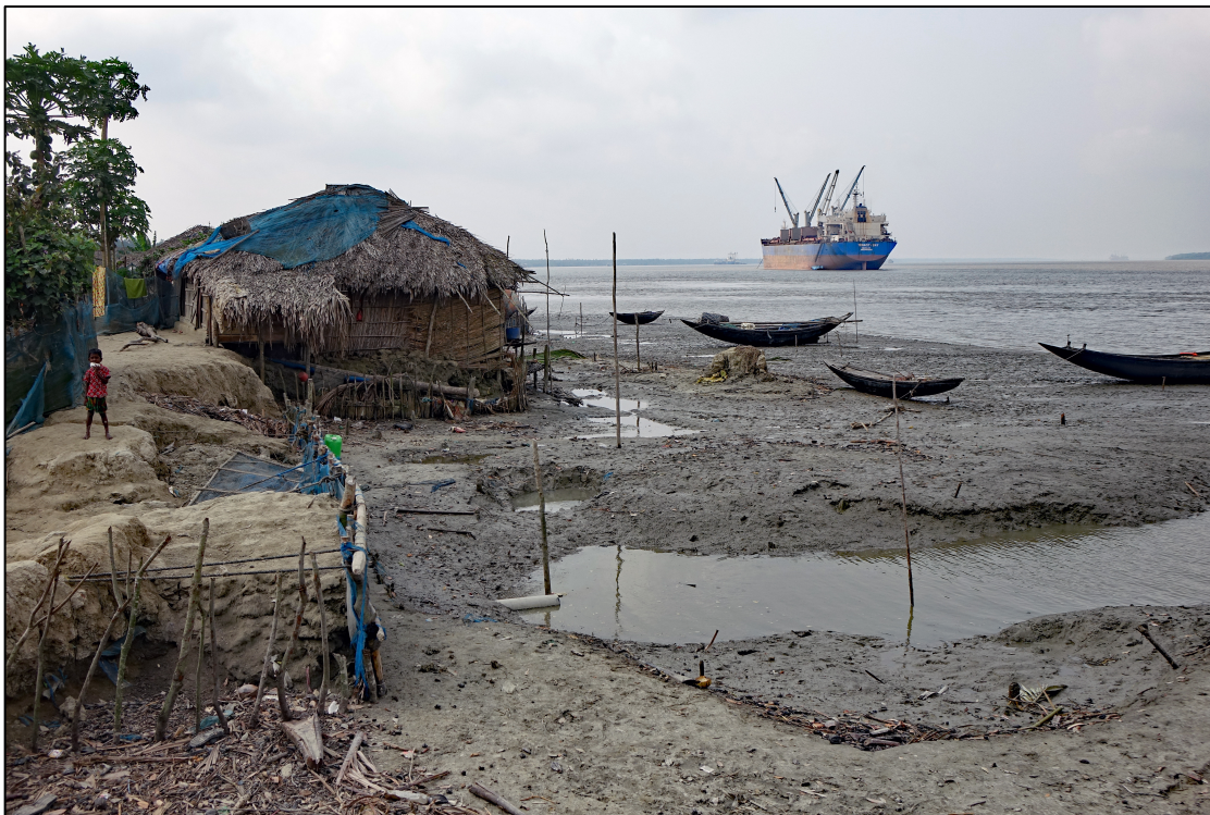
Bangladesh: living on the edge

https://www.stichtingphilippus.org/projecten-1/bangladesh-delight-children-school