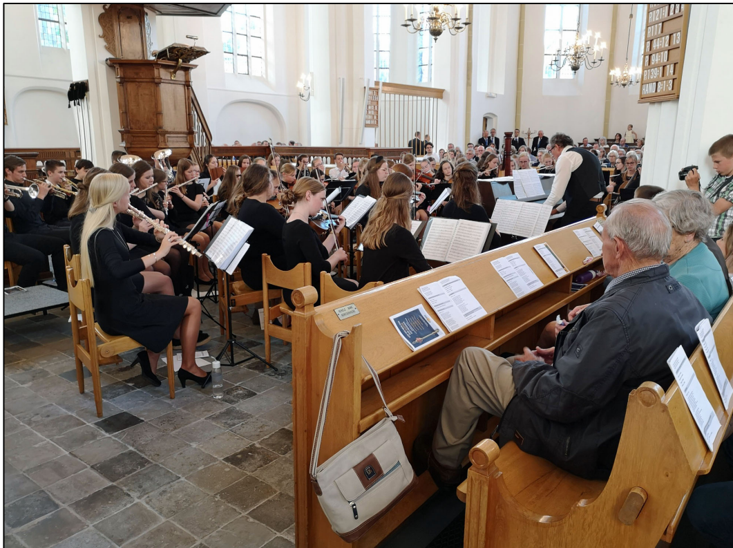
Tijdens een van de concerten (Stephanuskerk, Hasselt)

https://www.stichtingphilippus.org/muziekagenda