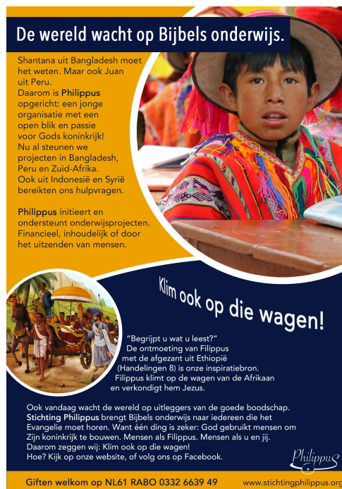
De eerste flyer