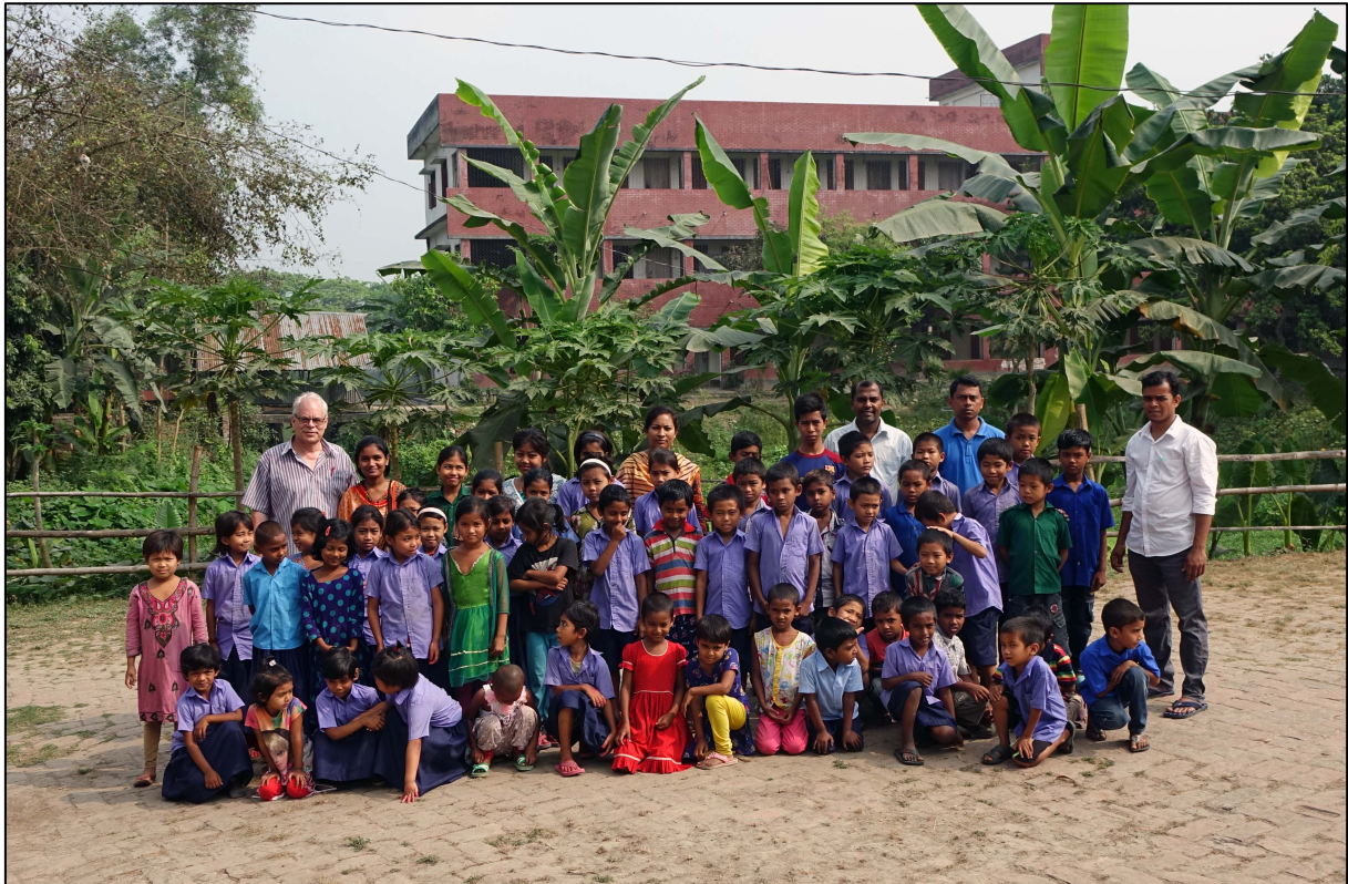
Bezoek aan Delight Children's Home and School, Kaligram, Bangladesh